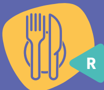
Diëtetiek campus Rumst